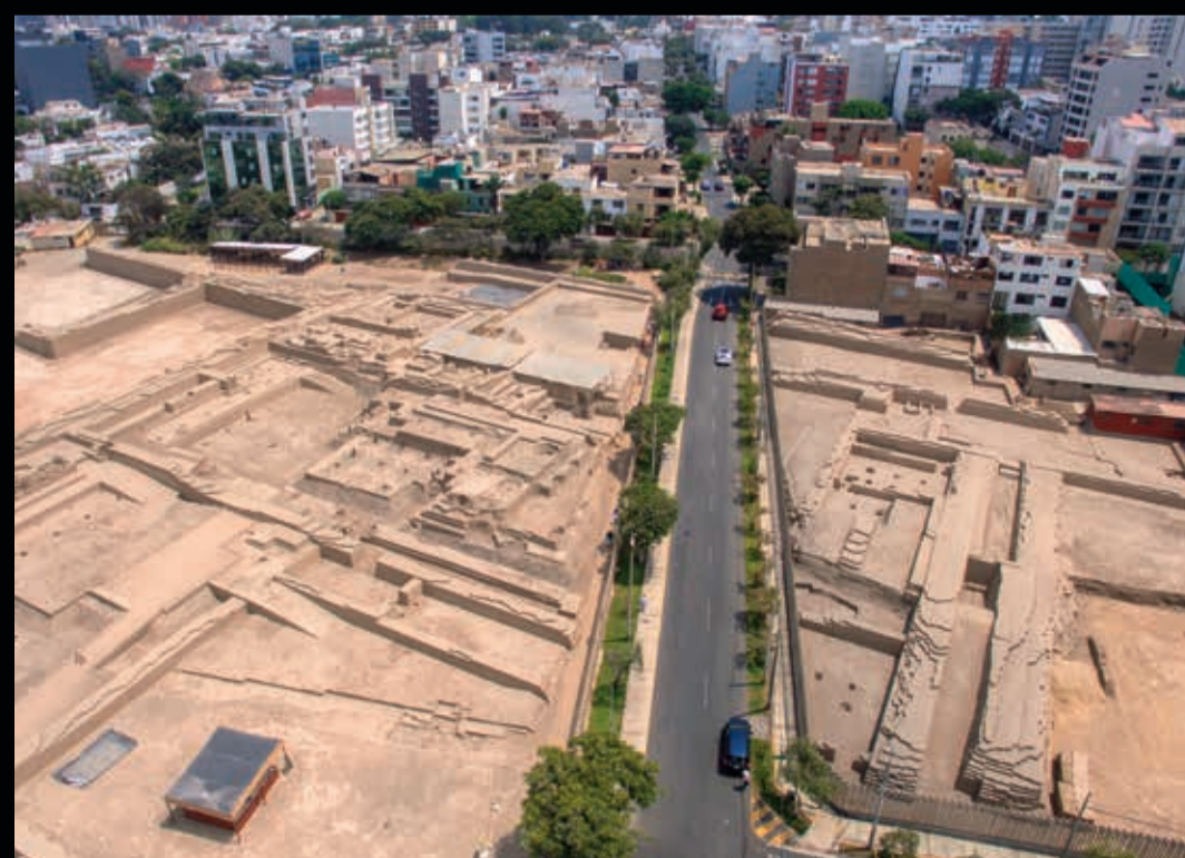
PUCLLANA (400 d.C.), DIVIDIDO EN DOS

LO ESENCIAL ES INVISIBLE A LOS OJOS ANTOINE DE SAINT-EXUPÉRY