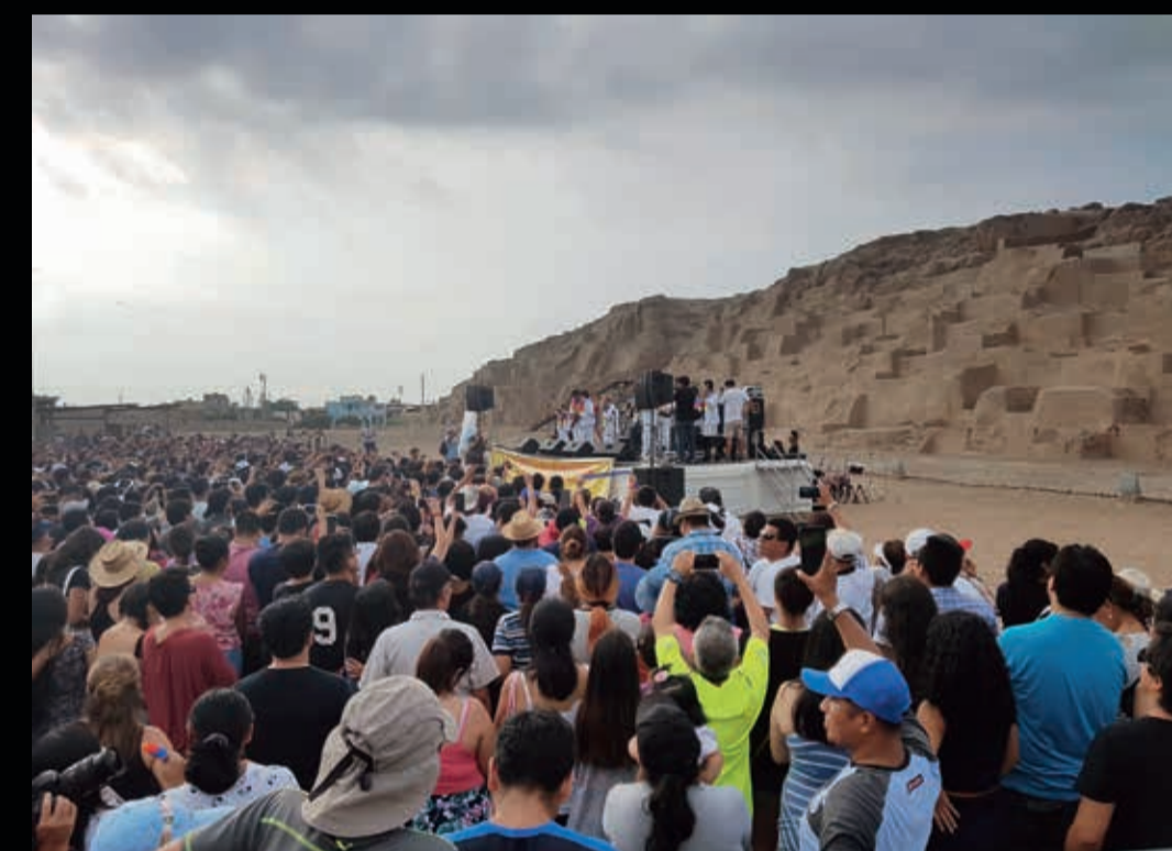
GRUPO MUSICAL "LOS SHAPIS" EN LA HUACA MATEO SALADO (1100 d.C.)